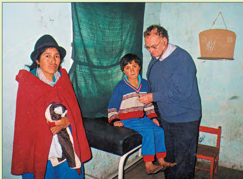
En mission en Equateur, un pédiatre, Volontaire du Rotary, ausculte des enfants dans les localités les plus isolées.